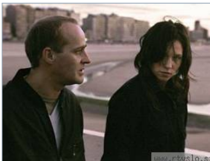
Najboljši celovečerec je Der freie Wille Matthiasa Glasnerja.